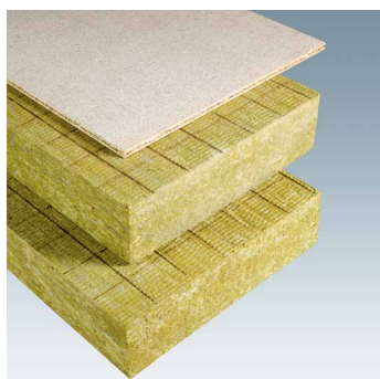
PARA con pannello truciolare separato

Risparmiare fino al 10 % sulle spese di riscaldamento è facile! Con gli elementi per pavimenti di soffitte della Flumroc.