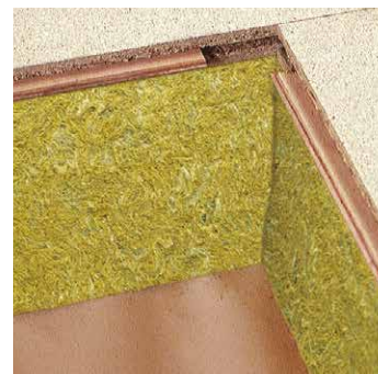
Montaggio semplice grazie alla giunzione a maschio e femmina

Isolando i pavimenti e i solai della vostra casa, risparmierete fino al 10 % dell'energia per il riscaldamento. Una soluzione che fa bene sia al vostro portafoglio che all'ambiente. Rinnovare la casa ha senso solo così!