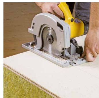
Taglio senza problemi con una sega circolare